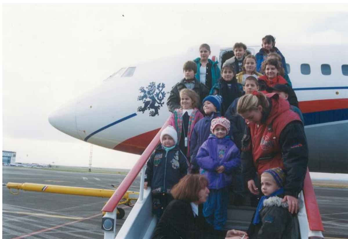
1. setkání v Praze v roce 1999

Velké poděkování patří všem, kteří tuto akci podpořili nejen finančně, ale také organizačně. Všichni máme na co dlouho vzpomínat.